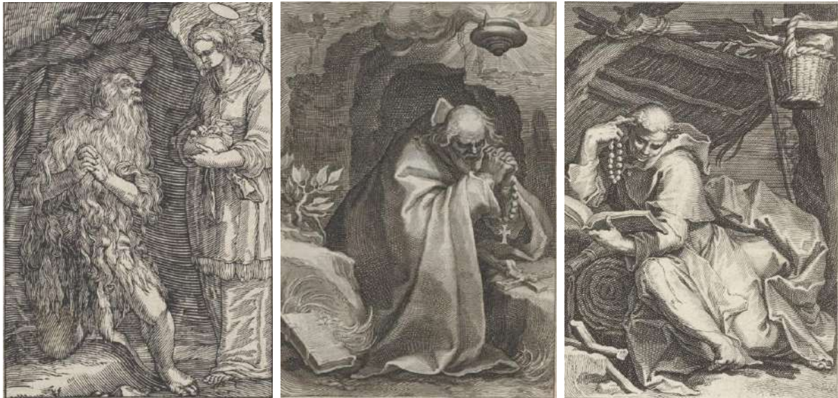
Van links naar rechts: Onophrius met engel, Macarius van Egypte en Hilarion van Gaza.