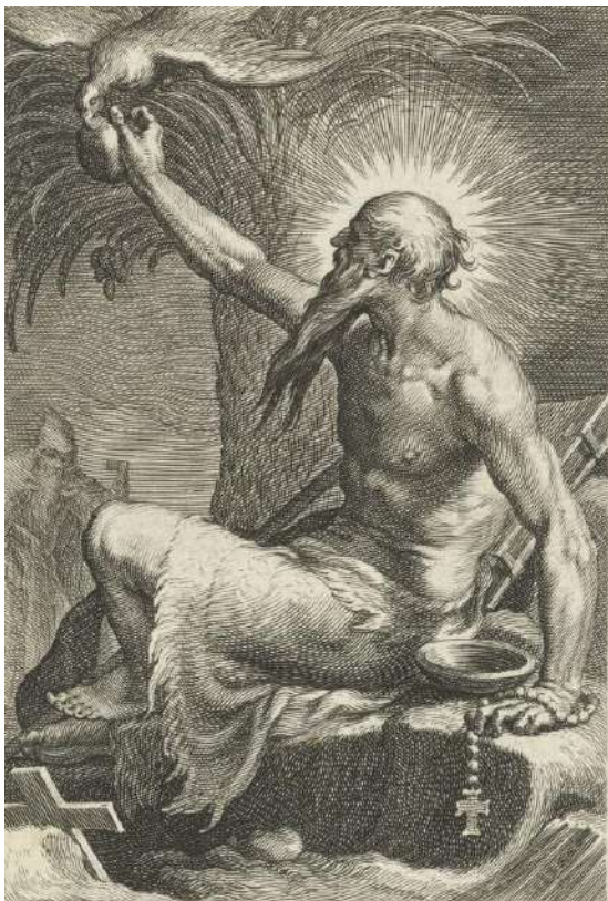
Paulus de Heremiet met de raaf

Tijdens een bezoek aan Keulen op Driekoningen zag ik in een etalage een verzameling van 25 gravures van Boëtius a Bolswert (1580-1633) van deze eerste kluizenaars. Boëtius werkte eerst in Amsterdam en later in Antwerpen. De gravures werden in 1619 door Hendrik Aerts uitgegeven in het boek Sylva Anachoretica Aegypti et Palaestinae . Met de gravures krijgen we een beeld van de eerste kluizenaars.