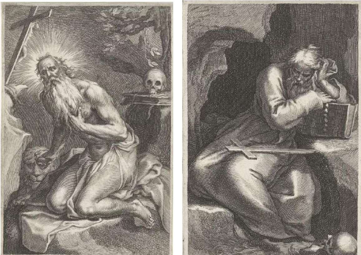
Links: Hieronymus met links de leeuw die vaak samen met hem wordt afgebeeld. Rechts: Arsenius.

Frontonius zou vanuit Turkije naar Frankrijk (Perigueux) zijn gezonden om er het Evangelie te verkondigen. Een bijzonder geval zijn de pilaarheiligen. De bekendste daarvan is Simeon de Pilaarheilige (390-459), die bij Aleppo op een platform bovenop een pilaar leefde. Vanaf zijn platform kon hij mandjes met eten omhoog hijsen. Niet alle kluzenaars werden monniken. Johannes van Lyco vertrok uit een klooster om, net als Elias van Egypte, weer als kluzenaar in de bergen te leven (394).