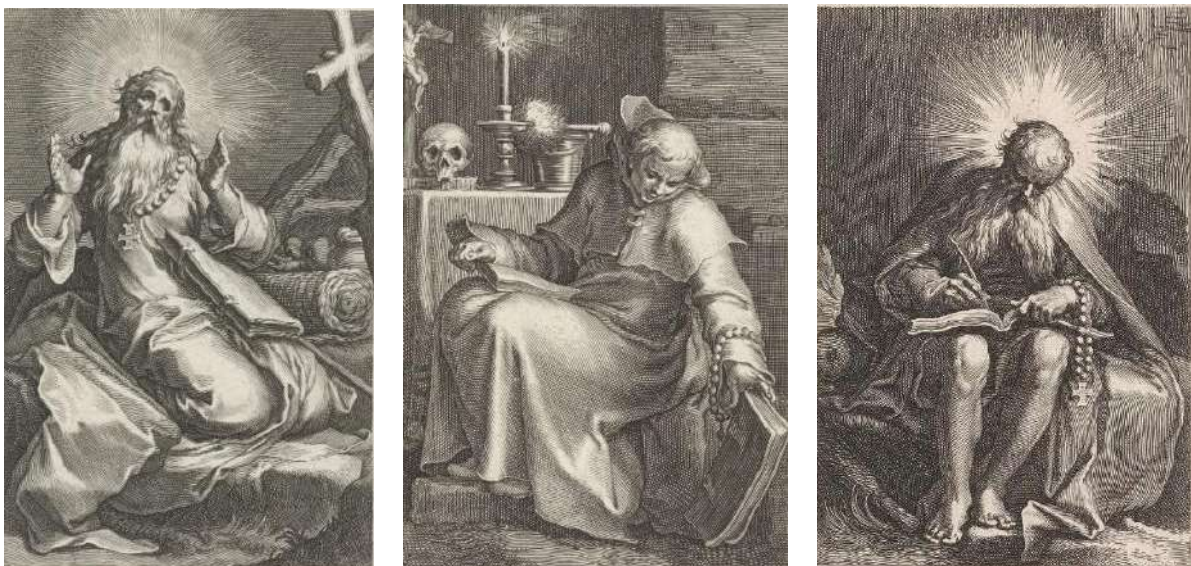
Van links naar rechts: Abraham Kidunaia, Basilus de Grote, Ephrem de Syriër

De volgende kluizenaar in de serie is Hilarion van Gaza (291-371). Geïnspireerd door Antonius Abt leefde hij in de woestijn in Gaza, waar mensen hem om raad vroegen. Van Malchus de Syriër werd een biografie geschreven door Hieronymus op basis van gesprekken die Hieronymus met hem voerde voordat Malchus in 390 stierf. In dezelfde periode leefde Onophrius als kluizenaar in de Egyptische woestijn. Hij wordt afgebeeld met een engel die hem in zijn kluizenaarsgrot brood brengt. Pachomus (292-348) was de eerste kluizenaar die een kloostergemeenschap van monniken en nonnen vormde. Macarius van Egypte (300-390) en Macarius van Alexandrië (300-395) werden door keizer Valens verbannen naar een eiland op de Nijl, waarna de inwoners door deze kluizenaars bekeerd werden.