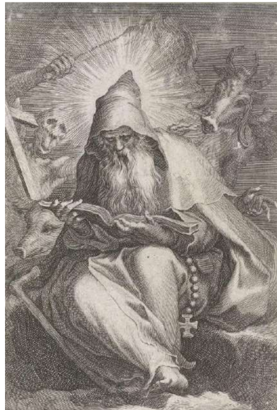
Antonius Abt met demonen en varken

Na de gravures van Christus en Johannes de Doper volgt die van Paulus de Heremiet (227-341). Hij zou het grootste deel van zijn leven in de woestijn geleefd hebben om aan de vervolgingen van keizer Diocletanus te ontkomen en zou daar door een raaf gevoed zijn. De serie gaat verder met Antonius Abt (251-356), die aan het eind van zijn leven Paulus zou hebben bezocht. Ook Antonius Abt leefde, gekweld door demonen, als kluizenaar in de woestijn. Een bezoeker zou Antonius gevraagd hebben