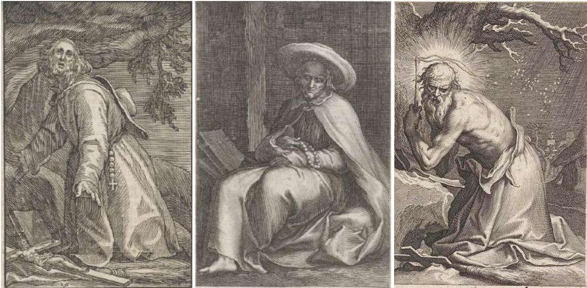
Van links naar rechts: Frontonius, Johannes van Lyco en Simeon de Pilaarheilige

zijn Basilius de Grote (330-378), die bekend staat om zijn zorg voor armen en de ontwikkeling van liturgie in de periode dat het christendom in het Romeinse Rijk werd toegestaan, en Ephrem de Syriër (306-373), een kerkvader die uitsluitend in het Aramees schreef.