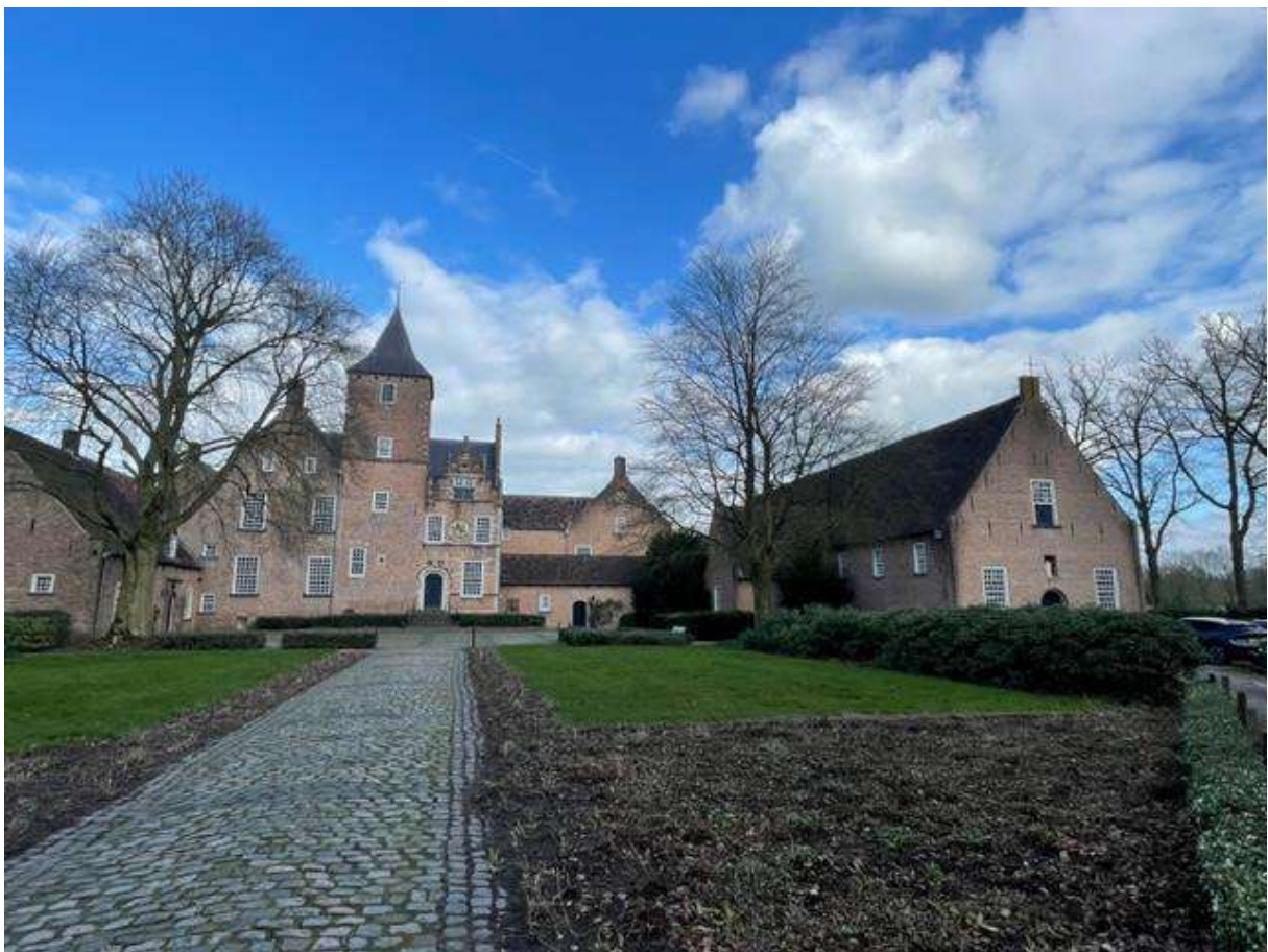
Boven: het klooster St. Catharinadal. De kruisweg hing in de kerk (schuur) rechts.