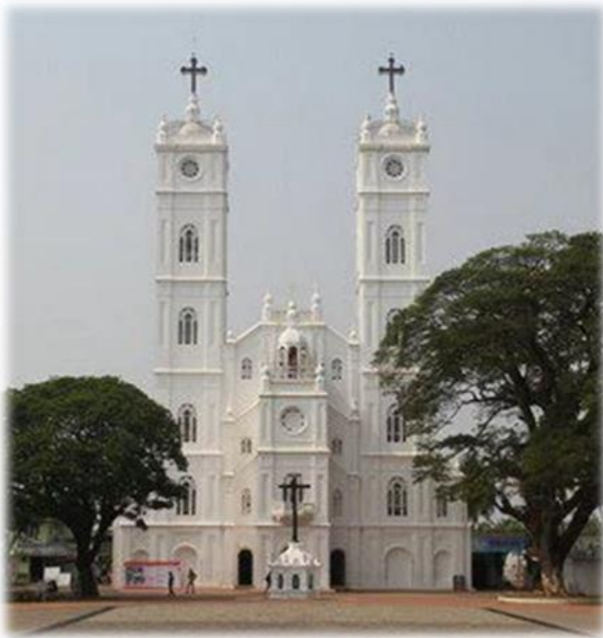
Heiligdom in Vallarpadam (National Shrine Basilica of Our Lady of Ransom) op eiland bij Kerala

A De geloofsbeleving. En wat mij wel opvalt in de dorpen hier, en ik ken eigenlijk alleen de dorpen, is dat de mensen gewoon naar mij toekomen, dat ze mij weten te vinden in de pastorie in Berg. Dat vind ik heel fijn. Het is goed hier.